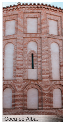
Coca de Alba.