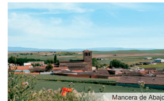
Mancera de Abajo.