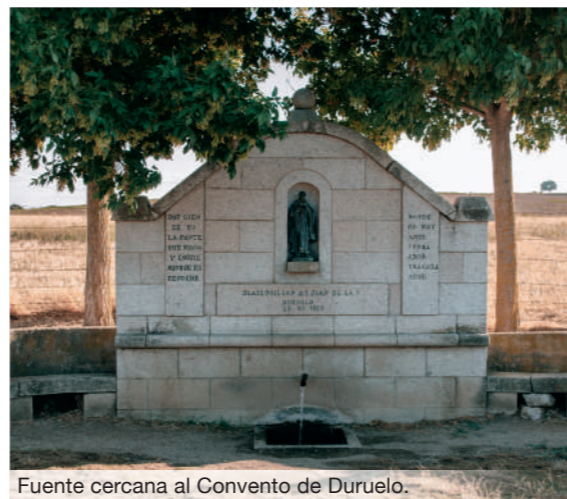
Fuente cercana al Convento de Duruelo.