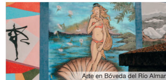
Arte en Bóveda del Río Almar.