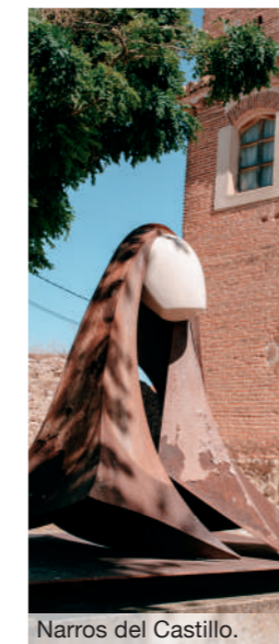
Narros del Castillo.