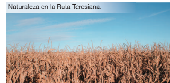
Naturaleza en la Ruta Teresiana.