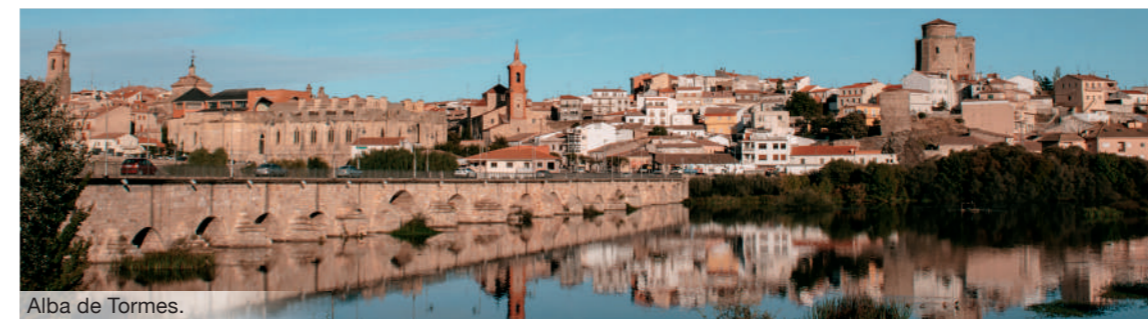
Alba de Tormes.