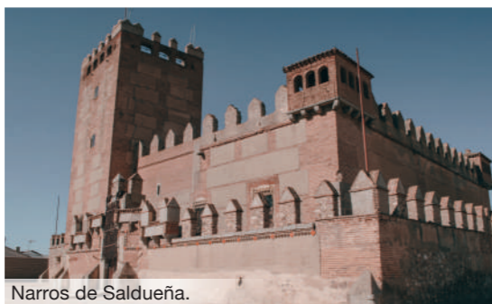
Narros de Saldueña.